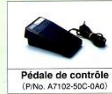
Pédale de contrôle (P/No. A7102-50C-0A0)