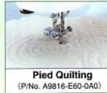
Pied Quilting (P/No. A9816-E60-0A0)